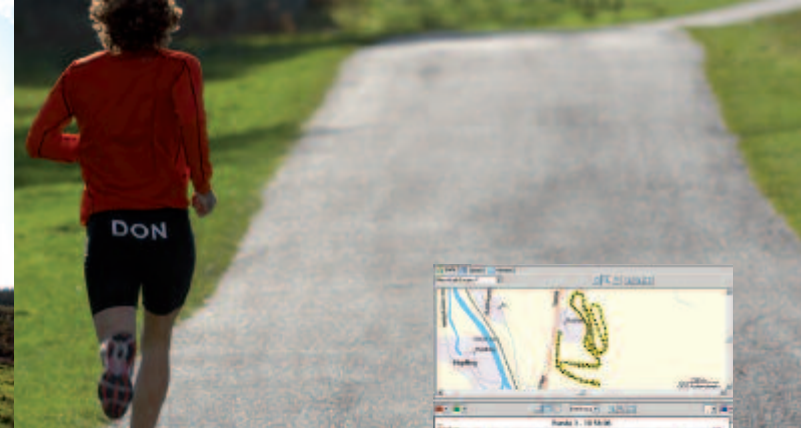
Tim Don 2006 ITU Triathlon World Champion